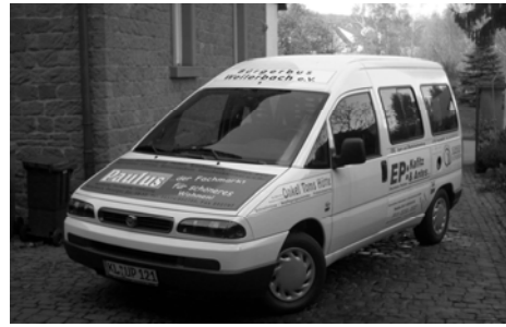
Bürgerbus in Weilerbach.

Da der Bürgerbusverein zwar ein e.V. ist, aber rechtlich nicht als gemeinnützig anerkannt werden kann, sollte man in die Überlegungen